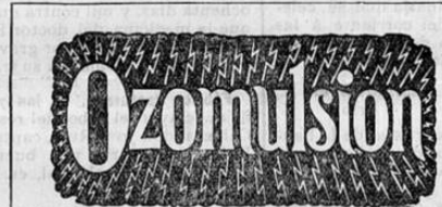
La Nueva Emulsión de Aceite de Hígado de Bacalao por Excelencia.

Está desapareciendo el color de su preciosa faz?